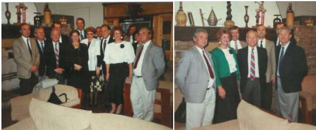
Olaszországi vendéglátók között

A külföldi tapasztalatok, az ULT támogatásával a Budapesti Dohánybeváltó Vállalat szakembereinél, a dohánytermelők jelentős részénél sikerült a dohánytermesztés vonatkozásában szemléletváltást elérni. Úgy ítélem meg, hogy az elért eredményekre alapozva a megszervezendő Dohánytermesztési Napok újabb lendületet adhatnak a dohánytermelőknek, a vállalati szakembereknek, a dohányiparban dolgozóknak, az irányító szervezeteknek. A döntést követően közel egy évvel korábban beindítottuk a szervezést. A rendszeresen megtartott megbeszéléseken konkrétan meghatároztuk a feladatokat, személyre lebontva, határidő megjelöléssel. A konténerekben nevelt díszítő dohányoktól