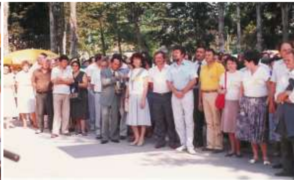
Szabadtéri kiállítás megnyitója

A gyakorlati bemutatón Kunadacson a kistermelői dohány termesztéstechnológiánkat, a vírusmentes körzet kialakításának tapasztalatait lehetett tanulmányozni; bakhátművelés, esőztető öntözés, csepegtető öntözés, tetejezés, kacsgátlás, tápanyag utánpótlás, növényvédelem, dohánytörés, dohány szállítása, dohány szárítása, dohány válogatása. A következő nap Tiszaalpáron a természetes úton szárított dohányfajták bemutatására került sor; köztermesztésben lévő, fajtajelöltek, honosítás alatt lévő, MMI kísérletek. A Kiskunmajsai gyakorlati bemutatón a mesterséges úton szárított dohányfajták kerületek bemutatására; köztermesztésben lévő, fajtajelöltek, honosítás alatt lévő, MMI kísérletek.